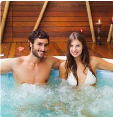
Piscina de hidromasaje en el área de spa de un hotel