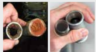
Sistema de tuberías