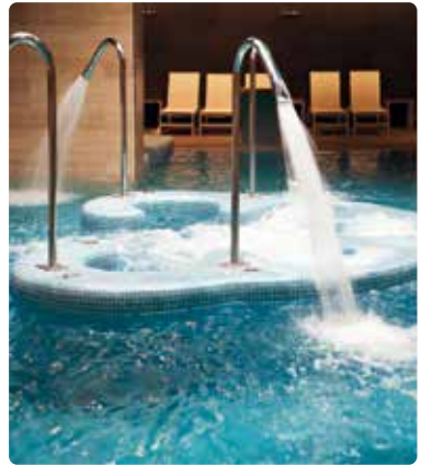
Piscina de agua salada termal

Las piscinas son sistemas con circuito medio abierto que pierden agua constantemente a medida que el agua se evapora. Incluso unos índices bajos de dureza de agua ocasionan depósitos calcáreos dañinos que exigen una limpieza constante. Vulcan disminuye los trabajos de limpieza en la piscina, como en las tuberías, baldosas, rejillas, pisos y paredes. La manutención de duchas, cabezales, grifos e inodoros se facilita sustancialmente.