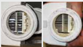
Filtro para piscina