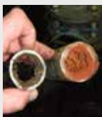
Sistema de tuberías