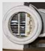
Filtro para piscina