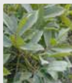
Plantas y césped