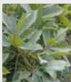
Plantas y césped