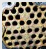
Tubo – intercambiador de calor