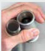
Sistema de tuberías