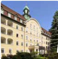
Hospital de St. Joseph, Berlín