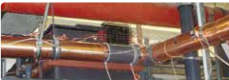
Vulcan S250 instalado en el Hospital St. Joseph

Sin duda, recomiendo sin duda alguna la unidad instalada de Vulcan S250 por CWT GmbH."