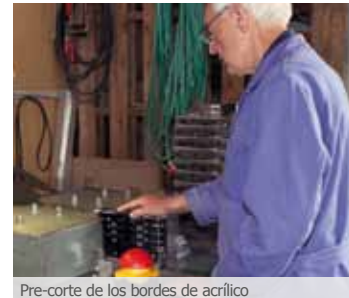
Pre-corte de los bordes de acrílico