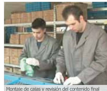
Montaje de cajas y revisión del contenido final

tel: +49 (0)30 - 23 60 77 8-0 fax: +49 (0)30 - 23 60 77 8-10 email: info@cwt-international.com web: www.cwt-international.com