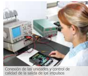
Conexión de las unidades y control de calidad de la salida de los impulsos

CWT – Christiani Wassertechnik GmbH Köpenicker Str. 154 10997 Berlin Alemania