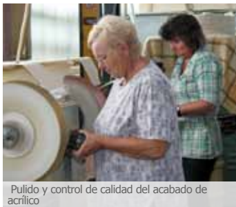
Pulido y control de calidad del acabado de acrílico