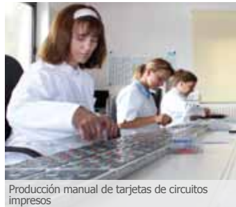
Producción manual de tarjetas de circuitos impresos