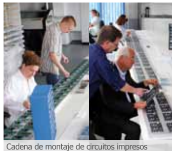
Cadena de montaje de circuitos impresos