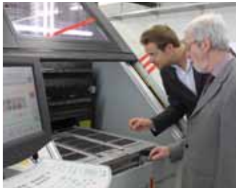
Producción especializada en circuitos impresos